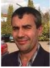
عنه ئی مه حمود محهمه د