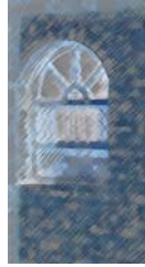
خەونە کانی زولە پىخا

ژنانم بينى ئالاي رهشيان به دهسته وه يه و له سه ر ريگاکان راکشاون و به سه ريانا بازده دن شه يتانى جه هل.