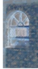
خەونە كانى زولەيخا

نىيە (۱۶) . ھەلاتم لە بىابانە كان خۆم دۆزىيەو:ه: "قەتارى زەنگ و قۆرى ئوشترو ئىستر لەسەر كەيوان دەللى زىرەى سەداى قازو قولنگى ئەوجى كەيوانە (۱۷) بىابانە كەى من دوورەدەست نەبوو،