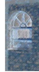
ئه حه دی مه لا

وه كو په ره ی گول ده كه و ته نیو چه وزی مزگه وتانه وه، نو یژی سو فییه ك بوو ده گه یشته باخه لی خو رییه كانی ده ور كانی، قه سیده یه کی ژیر مانگه شه و، بو كاروانه كانی دیوانه ده هو نرایه وه، تو په له به فری بوو له بهر ئاهی میرد مندالان ده توایه، ماچیک بوو ده گه رایه نیو قوزاغه ئه به دییه كه ی، پرچی كچیکی هه تاوینی گه رمیان بوو،