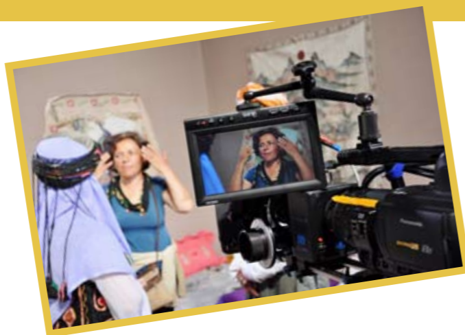
میره‌کی عه‌جه‌مان رویدایه .

قیان دبیزیت «خلیل ئاغا میره‌کی کورده ده‌خوازیت کچا خوه سهرمیخانی بدت میری عه‌جه‌مان بو پاراستنا ده‌سته‌لاتا خوه، به‌لی کچا وی ئاشقا «خورشیدی چاف ب خاله» رازی ناییت سهرمیخان دا خو قورتال بکه‌تن و شوی ب کوری میری عه‌جاما نه‌کت په‌نای ده‌بیت به‌ری میری ئیزدیان له باعه‌دری، میری عه‌جه‌مان هیزش دکه‌تن میری ئیزدیان و شه‌ر دناقبه‌را وان دا په‌دا بیت» .