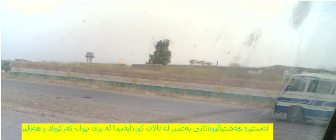
ئهستیره ههشتپالووهکانی بهعس له ئالای کوردایهتیدا له پری نیوان کهرکووک و ههولیر

کاتیك كه مروّف له رهفتاری دهسهلاتاران له كوردستان دهكۆلّيتهوه، دهگاته ئهوه سههرهجامهه كه گرنگينهدانی دهسهلات به پړنوینی و نیشانهکانی هاتووچۆ یا بۆ ئهوه دهگهپّيتهوه كه ترومبیل و کاروانهکانی لیپرسراوان هاژوشتنیان سنووردار نهکریت، یا ئهوهتا بازارنازاد به پّیچهوانهه تهواوی دونیاوه له كوردستان نهك تهنیا نرخ و پشتیوانهه دهولّتهه بۆ ههزران راگرتنی بازار وهلا دهنیت، بهلکو نیشانه و پړنوینییهکانی هاتووچۆش دهگاته یاداوهه سهردهمی بهعس و هاژوشتنیش ئازاد دهکات و یاسای جهنگهّل – بههیز و بیهیز- دههینّيته کایهوه و شوّقیران دهبیت به ملکهچیهوه له گشت کات و شوینّیکدا خویان بۆ ترومبیله جام تاریکهکان لادهن، ئهگهرا ملیان لی دهنریت.