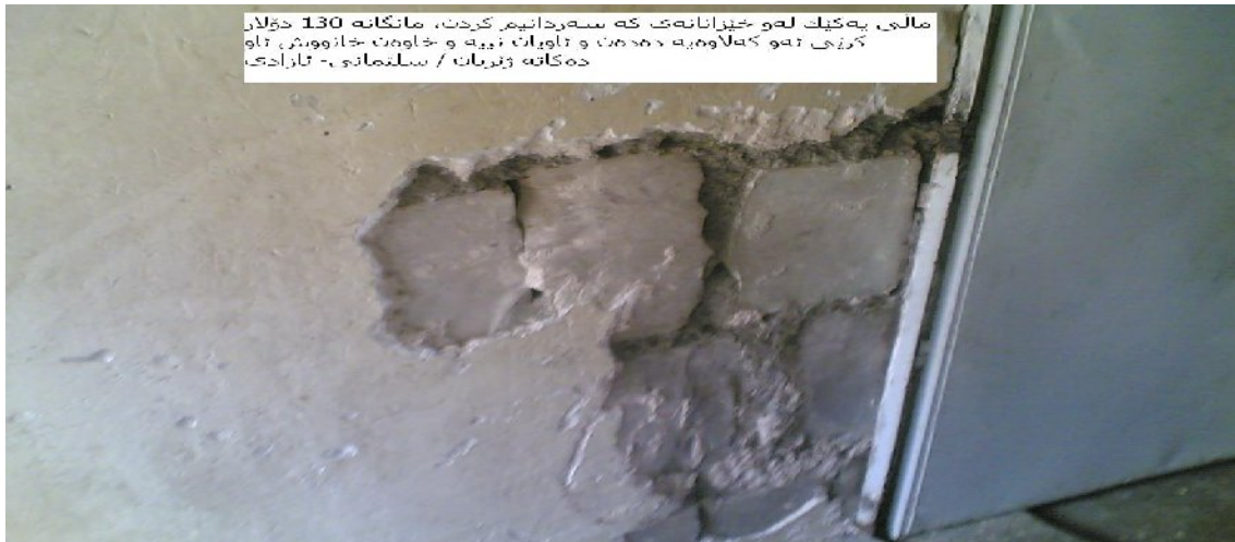
مالى بەكەك لەم خەزانەى كە سەردانىم كەت، مانگانە 130 دۆلار كۆزى تەو كەلاوێه دەست و تاویات نێه و خاوەن خانووش، تاو دەكانە ژێرناك / سلێمانى - ئازادى

وهك وتم پارت دەسەلاتدارە و ھەموو داھاتی كۆمەلگەى لەژێر دستدایە و زۆرینەى داھاتەكان بۆ ئامانجەكانى خۆى دەخاتەگەر. پارت كارگە و كارخانە و زەوى و گرد و دار و