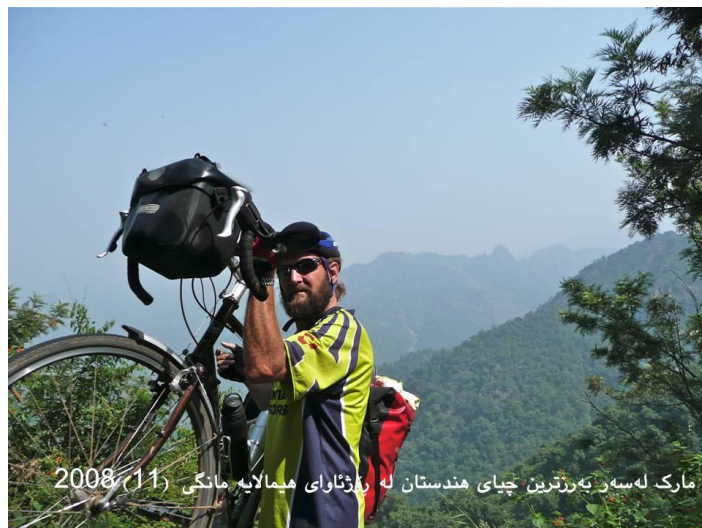
مارک له سه ر ترترين جياي هندستان له روظناوای هيمالايه مانگی (11) 2008

وهلام: له ۲۳ مانگی ته مووزی سالی ۲۰۰۸ يه که مين هه نگاوی گه شته که مان دهستی پیکرد له شاروچکه ی (دينگل -Dingle) که ده که وينه نيچه دوورگه ی که ناری روظناوای نایرلاند، (سام) نهو شاروچکه يه ی هه لېژارد بو خالی دست پیک به هه ر شيويه که بوو رازی کردم هه رچه ند ۸۰۰۰ کیلومه تری زيا دی خسته سه ر ريگای گه شته که مان، زور جار بو سه هری کورت و پشودانی خيزانی نه چووينه نهو شاروچکه يه وه ک مانی دووه مان وا بوو بومان، دانيشتوانه که ی پيشوازيه کی جوان و شياويان لی کردین و به گه رمی مالساويان لی کردین له که ناله کانی ته له فيزيونی نایرلاند اووه ساتی ده ستيپيکرمان په خشکرا.