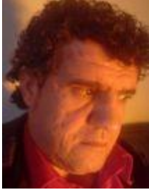
ئامادەكردنى: قادر غەبدولسەمەد

مارك سواين ھاۋالاتىيەكى بەرىتانيە ئە (فۆلكستون - كىنت) ئەزى، بۇ ماۋەى زىاتر ئە سى ھەفتە ئەگەل كۆمپانىيەى نۇكيا ئە (ھەولېر) كارى كىرەۋە، نوسەرى كىتېبى (رېگاي دىرېژ.. وانەى سەخت) ئە يانە كەلتورەيەكەى كە وېسىگەى چىنىنى نوسەر و ھونەرەند و رۇشنىبىرانە زىاتر يەكترمان ناسى باسى ھۆكارەكانى نوسىنى كىتېبەكەى بۇ كىردم بەراستى زۇر پىنى سەرسام بووم، بەسەرھات و چىرۆكى نوسىنى كىتېبەكەى ھانى دام ئەم دىمانەيىيەى ئەگەلدا بىكەم.