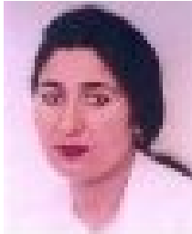
گۈلانە پشدرى - ھۆلەندا